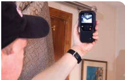
FLIR MR160 fase di scansione di una giunzione tra soffitto e muro alla ricerca di problemi di umidità.